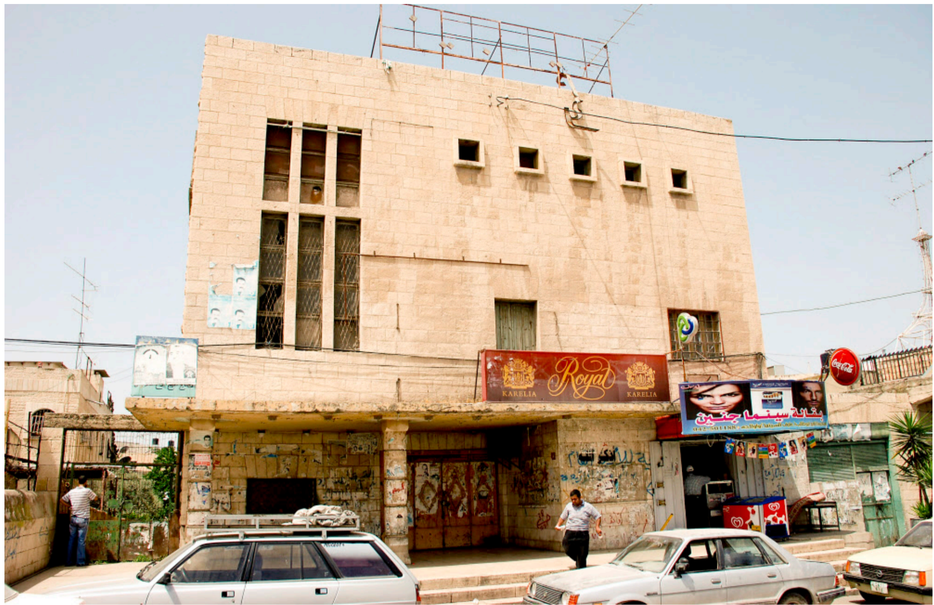
Seit fast zwanzig Jahren ist es geschlossen, das Cinéma Jenin – nun wird weltweit Geld für die Wiedereröffnung gesammelt.