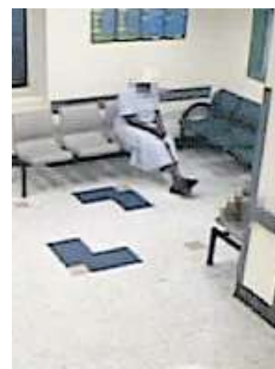
Video kameras haben den einsamen Tod der Frau dokumentiert.