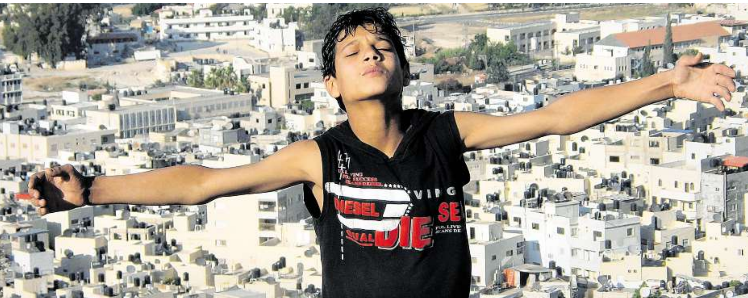
Über den Dächern von Jenin: Bleibt eine Zukunft in Frieden und Freiheit für diesen palästinensischen Jungen nur ein Traum? Ein Dokumentarfilm und ein Hilfsprojekt zeigen, dass Versöhnungszeichen im Nahen Osten möglich sind.