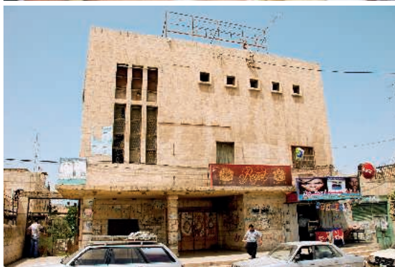
ZIAD BAKRY/MARCUS VETTER